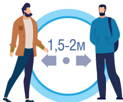
СОБЛЮДАЙТЕ РАССТОЯНИЕ И ЭТИКЕТ