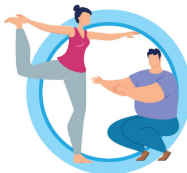
ВЕДИТЕ ЗДОРОВЫЙ ОБРАЗ ЖИЗНИ